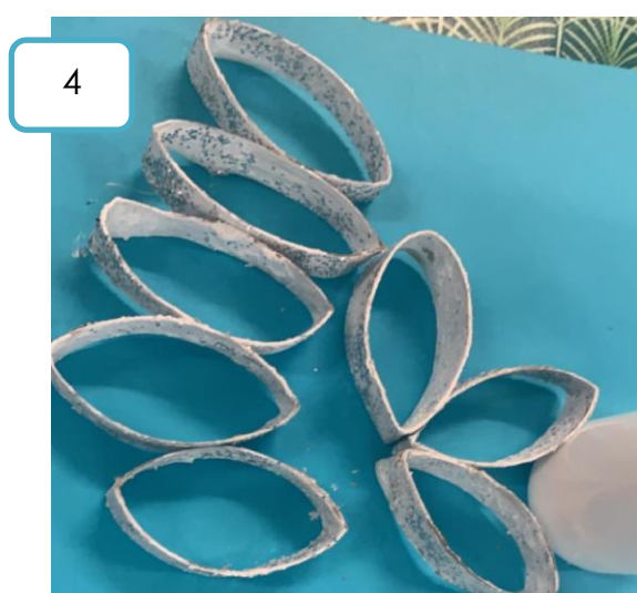
Limma ihop delarna till en stjärna, dekorera med en pärla.